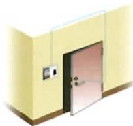
管理ソフトウェアなし