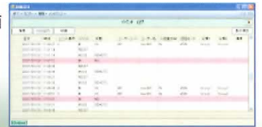
管理ソフトウェア画面